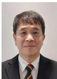
副主席劉偉卓先生